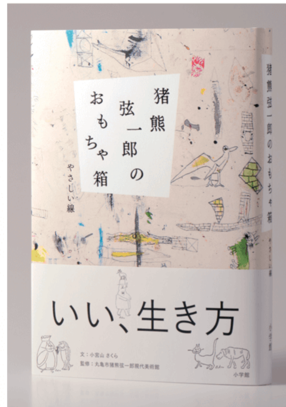
書籍『猪熊弦一郎のおもちゃ箱 やさしい線』(小学館 2018年2月発行)

会期中無休 [開館時間]10:00-18:00 (入館は17:30まで) 子ども(高校生以下または18歳未満)は無料