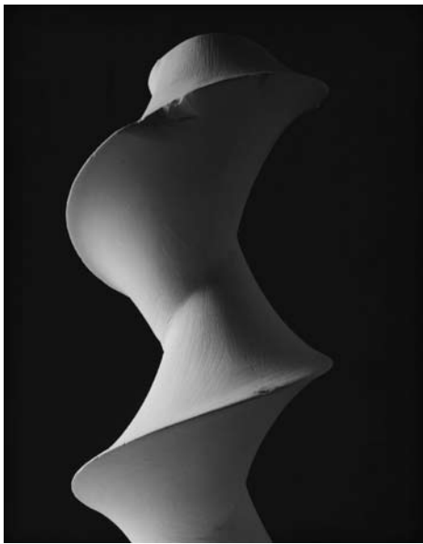
Mathematical Form: Surface, 0003, 2004 Dini's surface: a surface of constant negative curvature obtained by twisting a pseudosphere