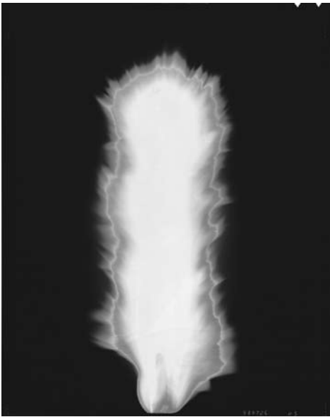
In Praise of Shadows, 1998 —all images © Hiroshi Sugimoto / Courtesy of Gallery Koyanagi