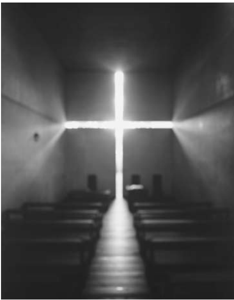
Church of the Light, 1997