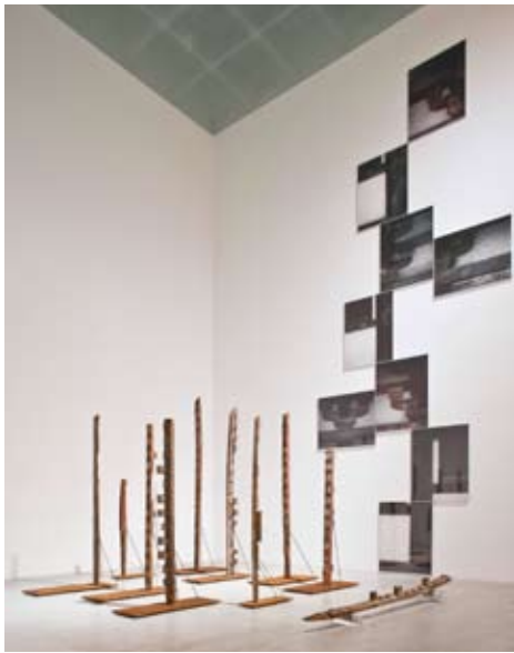
Anti-gravitation Structures, 2008 Installation view from "Hiroshi Sugimoto: History of History" at 21st Century Museum of Contemporary Art, Kanazawa, 2008–09

一年間にわたり一人のアーティストを4つの連続する展覧会によって紹介する、他に類を見ない画期的なプロジェクト「杉本博司 アートの起源」。2010年11月よりはじまったこのプロジェクトでは、独自のコンセプトと最高の技術から生み出された美しくも力強い杉本芸術が、科学・建築・歴史・宗教という根源的な4つのテーマから「アートの起源」へと収斂し、その全貌が明らかにされていきます。