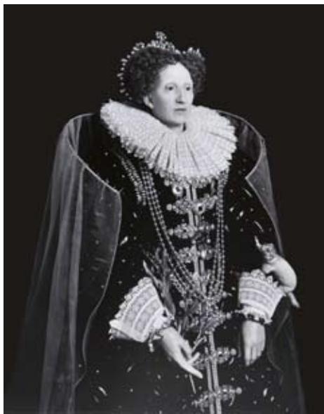
Elizabeth I, 1999