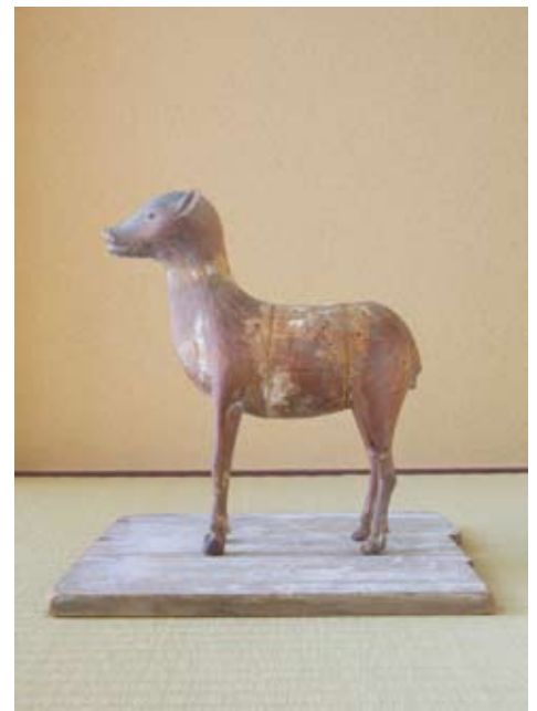
Kasuga Deer Deity, Heian Period

Yves Saint Laurent 1965, Dress: Collection of the Kyoto Costume Institute