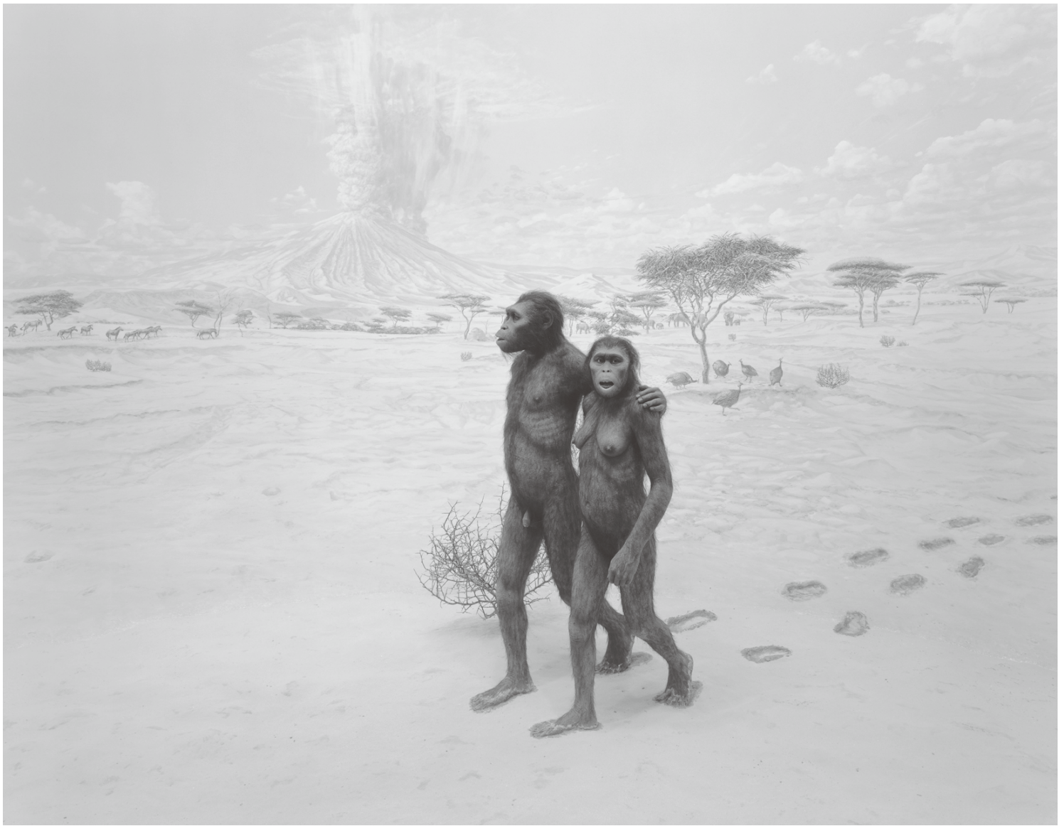
Earliest Human Relatives, 1994 ©Hiroshi Sugimoto / Courtesy of Gallery Koyanagi