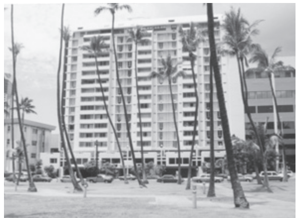
猪熊先生のハワイのアトリエ (13F)