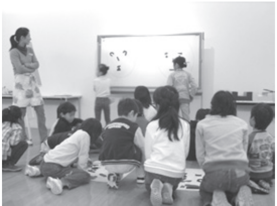
ワークショップ「猪熊先生をかこう」(1991年)