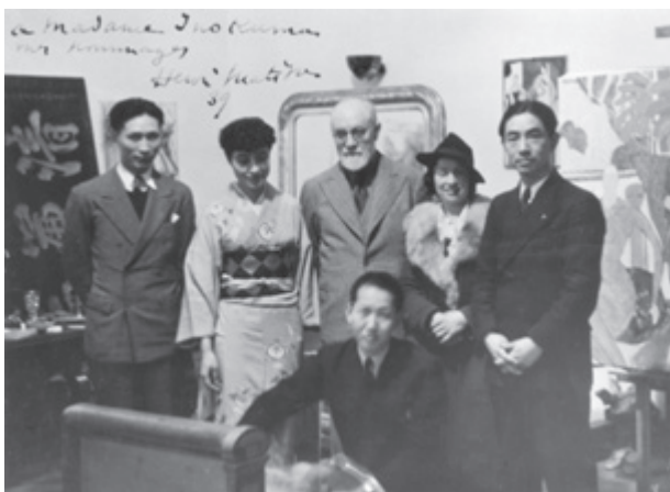
1939年 ニースのマチスのアトリエ (後列中央がマチス、右端が猪熊先生)

(昭和十五年)戦況はますます激化し、やむなく帰国を決意する。同年六月十四日パリ陥落の日、マルセイユから最後の避難船「白山丸」で帰国の途についた。写実の代表作と言われる「マドモアゼルM」は、ドイツ軍の空爆音が響く中、命がけて描