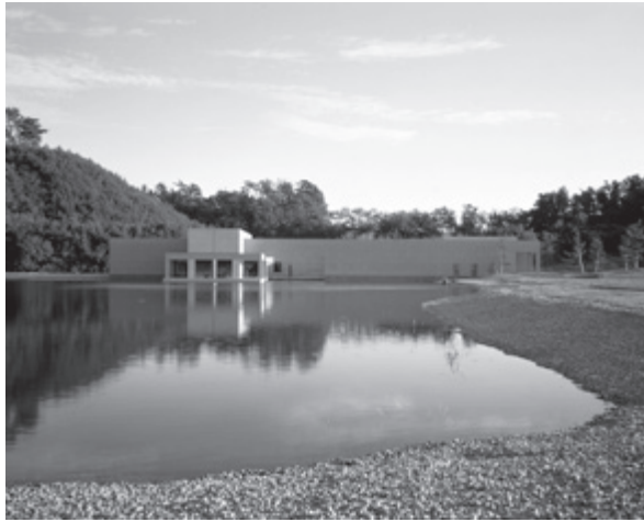
土門拳記念館 山形県酒田市