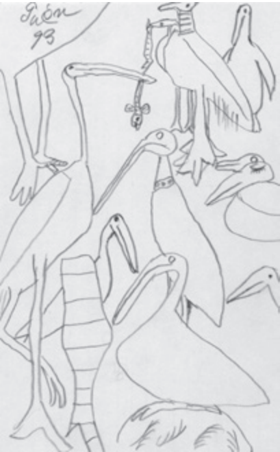
猪熊弦一郎《題名不明》1993年