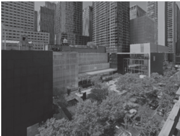
MoMA (モマ / ニューヨーク近代美術館) 米国・ニューヨーク