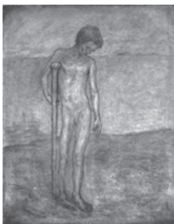
猪熊弦一郎《少年》1922年

昼前、近くの丸亀港から高速艇で本島に渡った。先生にとつては七〇年ぶりの本島であったが、すっかり様変わりして昔の面影はなかった。プール付きのホテルが建ち、ヤシの木も植えられていて、「まるで外国に来たようだ。」といわれたが、目の前に広がる瀬戸大橋の景観には