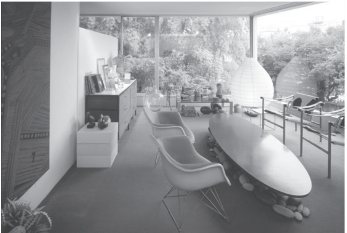
東京・田園調布の猪熊先生宅のリビングルーム

1987年（昭和六二年）二月二五日、白石先生の紹介状と市長の書簡を持って、部長に随行して東京・田園調布のご自宅を訪ねた。探し当てたお宅は白いモダンな建物で、黄色の玄関ドアと大きなオリーブの木が印象的だった。階段を上がり二階の部屋に通された。先生はかくしゃくとさかれていて、穏やかな雰囲気緊張が和らいだ。丸亀市周辺の状況や目指すまちづくりなどについて説明し、新しいまちの顔として先生を記念する美術館を建設したいとの思いを話した。じつと聞いておられた先生がまずいわれたのは、「美術館は経済的には成り立たない、いわば道楽息子のようなもので、お金は出ていくばかりです。経済的なことを考えるなら止めておきなさい。芸術や文化は経済とは最も遠いところにあつて直ぐ、目に見えて結果が出るようなものではありません。しかし、その波及効果には計り知れないものがあります。特に、子どもや若い人に及ぼす影響は限りなく大きなものです。」と。また、「美術館は襟を正すようなところではなく、人々が生活する街の中にあつて、エネルギーを与えるところです。子どもや若者、買い物帰りの主婦など