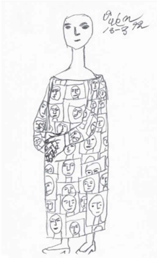
猪熊弦一郎《題名不明》1992年