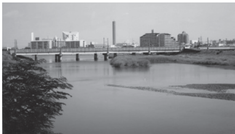
城北小学校近くの土器川（現在）