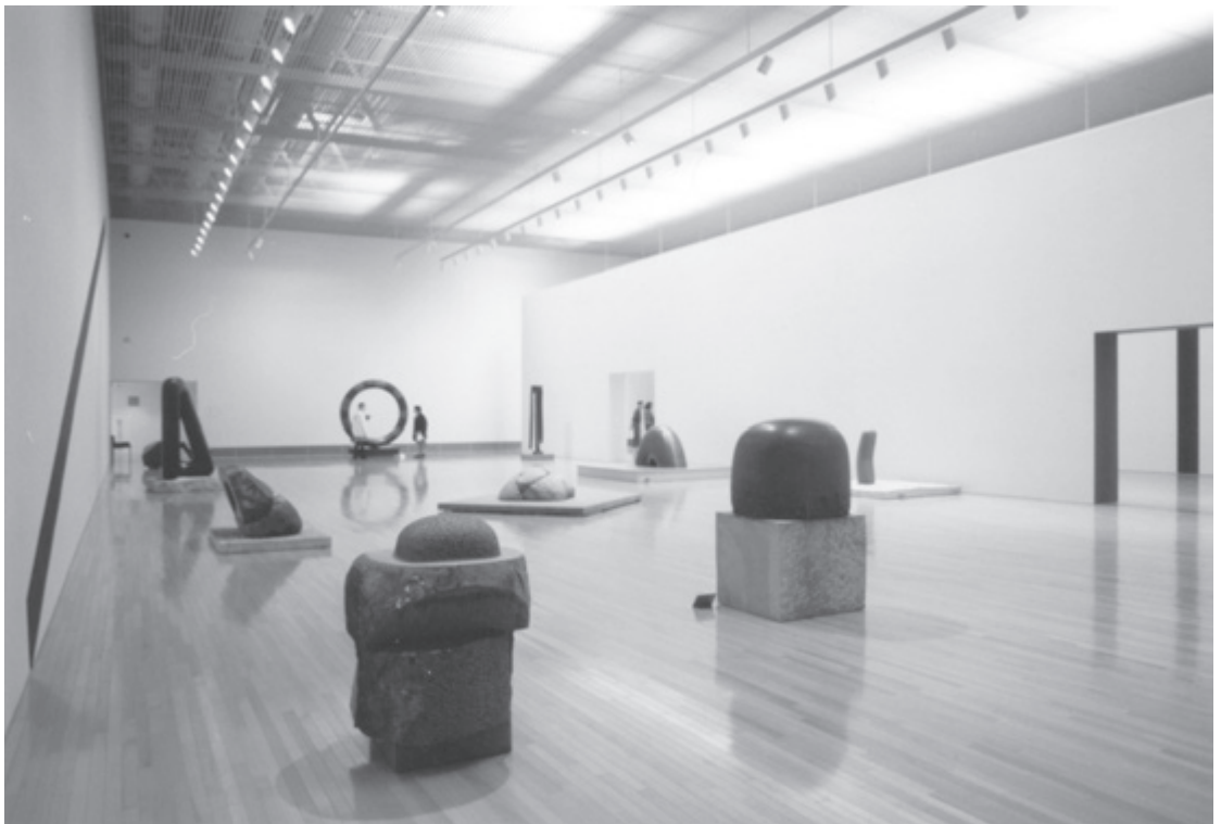
「心友イサム・ノグチとともに」展示風景 (MIMOCA, 1992年)

先生は亡くなる二日前までミモカに滞在していた。元気に帰京された翌日、知人から紹介されたアメリカ人の二世の方が、「イサム・ノグチの話を知りたい。」と訪れていた。先生はノグチさんの話になるといつも熱くなったが、このころ、先生にとって最大の関心事は牟礼のアトリエの行く末のことであった。ノグチさんが亡くなった後もアトリエがそのままの姿で美術館として残ることを切望していた。この日も来客とその話になり、アトリエは掛け替えのないものだということが、言葉の関係もあって相手にうまく伝わらないもどかしさがあったのか、ひどく興奮していたという。話の途中で体の不調を