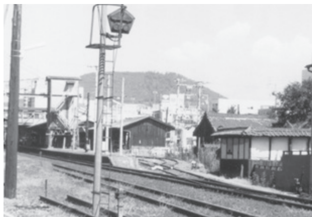
正面左手は旧貨物ヤードの建物、右手前は遺贈された藤井邸

当時、清算事業団は旧国鉄資産の処分を急いでいたが、全国的な地価の高騰が社会問題化し、入札処分が凍結されていた。そのため随意契約による地方自治体への売却についても慎重で、払い下げの申請から最終の契約までに少し時間を要したが取得することができた。その他の用地についても土地収用事業の認定手続きやお堂の処分、墓石の移転などを行い取得していった。その過程では、地権者との交渉のほか関係機関への様々な手続きもあったが、同僚