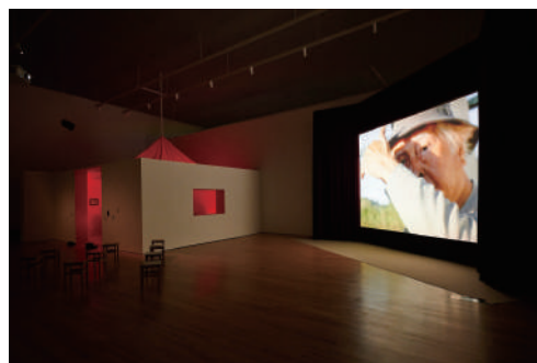
山城知佳子《ベラウの花》2023年 当日演奏会場

また「令和3年度(第72回)芸術選奨 美術部門 文部科学大臣新人賞」(2022年)、「第31回(2020年度)タカシマヤ文化基金タカシマヤ美術賞」(2021年)、「Tokyo Contemporary Art Award (TCAA) 2020-2022」(2020年)、「第64回オーバーハウゼン国際短編映画祭ゾンタ賞」(2018年)などを受賞。