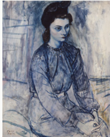
上段左〈題名不明〉1919年 上段右〈習作(美術学校時代)〉1925年頃 中段左〈画室〉1932年 中段右〈魚と女〉1939年 下段 〈マドモアゼルM〉1940年 すべて©The MIMOCA Foundation