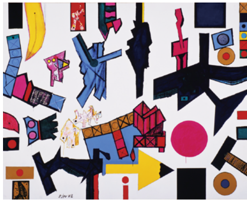
猪熊弦一郎《No.1 星からの手紙(ラブ)》1983年 丸亀市猪熊弦一郎現代美術館蔵

猪熊さんはいろいろな国に住んでいた画家です。パリ、ニューヨーク、そして、70代になってからは東京とハワイを行ったり来たりしながら絵を描きました。この展覧会では、猪熊さんがハワイに住んでいた時に描いた絵を見ることができます。猪熊さんがハワイで撮った写真もあります。みんなはハワイと聞いて、何を思い浮かべますか？猪熊さんがハワイでどんな絵を描いたか、よく見てみよう！