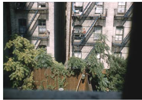
《我家の裏庭》1958年、撮影：猪熊弦一郎