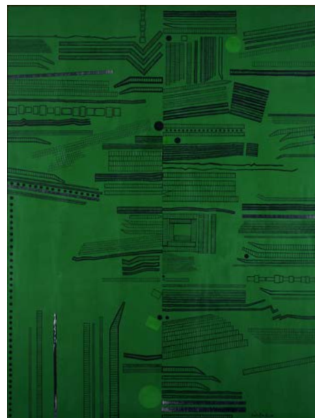
《The City (Green No.4)》1968年