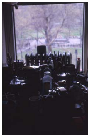
《アトリエの窓》1962年、撮影：猪熊弦一郎