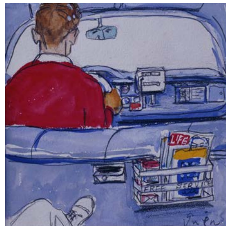
《タクシー》「小説新潮」表紙絵1960年5月号