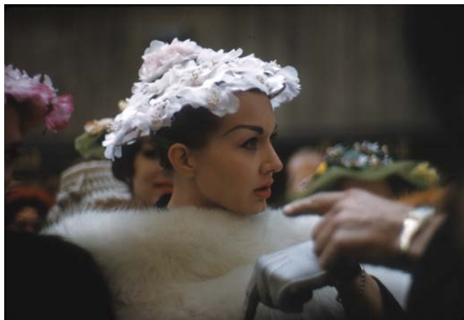
《セントパトリックデー》1959年