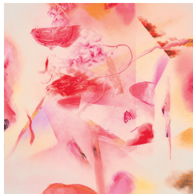
小金沢健人『正方形並行生成』2023より