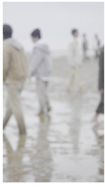
1 《彼方》 2022年 | 2 《チンピン・ウェスタン 家族の表象》 2019年 3 《沈む声、紅い息》 2010年 | 表面 《ベラウの花》 2023年 すべて © Chikako Yamashiro. Courtesy of Yumiko Chiba Associates