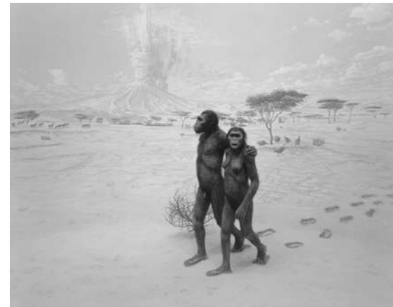
Earliest Human Relatives, 1994 ©Hiroshi Sugimoto / Courtesy of Gallery Koyanagi

開館時間: 10:00–18:00 (入館は17:30まで) 会場: 丸亀市猪熊弦一郎現代美術館 主催: 丸亀市猪熊弦一郎現代美術館、財団法人ミモカ美術振興財団 協力: 財団法人小田原文化財団、ギャラリー小柳 観覧料: 各展覧会チケット: 一般950円(760円)、大学生650円(520円)、高校生以下・丸亀市在住の65歳以上・各種障害者手帳をお持ちの方は無料 *( )内は前売り及び20名以上の団体料金、常設展料金を含む 年間パスポート: 2,500円 *2010年11月21日–2011年11月6日までの会期中、お1人につき何回でも使用できます。 11月23日は開館記念日のため観覧無料 チケット発売場所: 丸亀市猪熊弦一郎現代美術館1階受付 チケットぴあ [チケットぴあ、サークルK・サンクス] 0570-02-9999 pia.jp/t [Pコード: 科学764-159、建築764-160、歴史764-161、宗教764-162、年間パスポート764-163]