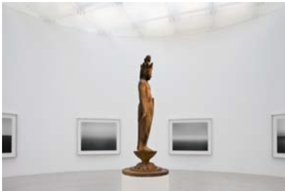
Standing Figure of Jūichimen Kannon (Ekadāsamukha) and Seascapes Installation view from "Hiroshi Sugimoto: History of History" at 21st Century Museum of Contemporary Art, Kanazawa, 2008-09 ©Hiroshi Sugimoto / Courtesy of Gallery Koyanagi

Hours: 10:00–18:00 (No admittance after 17:30) Venue: Marugame Genichiro-Inokuma Museum of Contemporary Art Organized by Marugame Genichiro-Inokuma Museum of Contemporary Art, The MIMOCA Foundation Cooperation provided by Odawara Art Foundation, Gallery Koyanagi Admission: Adults ¥950, Students (college, university) ¥650, Children (0 year to highschool) free Passport: ¥2,500 (The passport is valid for one person throughout the period [21 November, 2010 to 6 November, 2011] and unlimited entry.) *Ticket valid for admission to Permanent Collection.