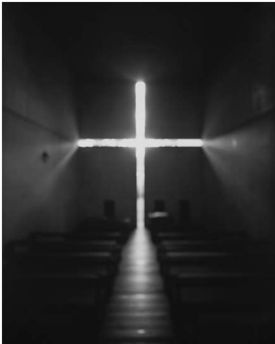
Church of the Light, 1997