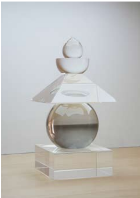
Five Elements, 2011 (Boden Sea, Uttwil) Pagoda, 2010/Inlaid Seascape film, 1993