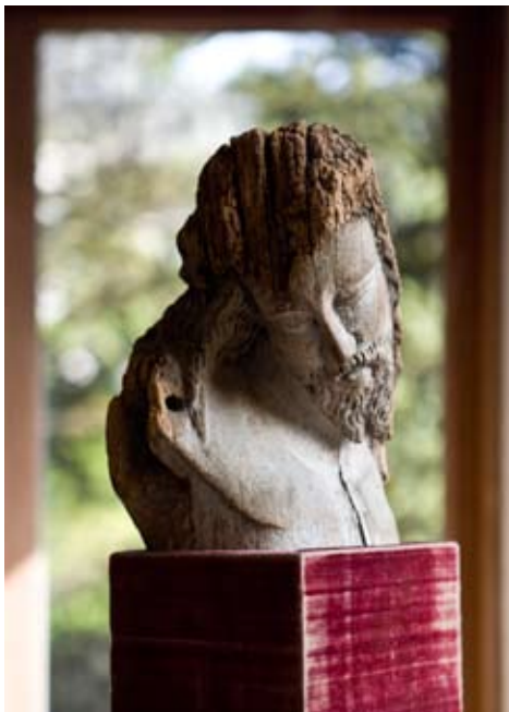
Bust of Christ, 14th century